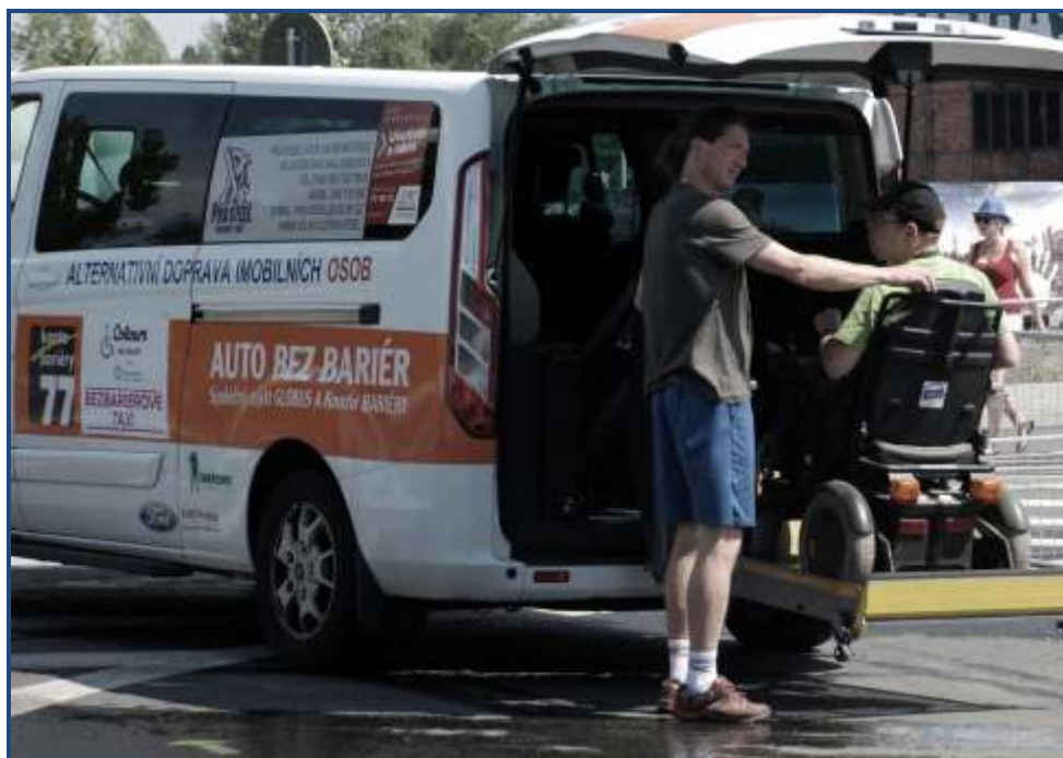
Dopravní služba mimo pravidelných přeprav se také aktivně účastní přepravy vozíčkářů na festivalu Colours of Ostrava. Archivní snímek z roku 2018.