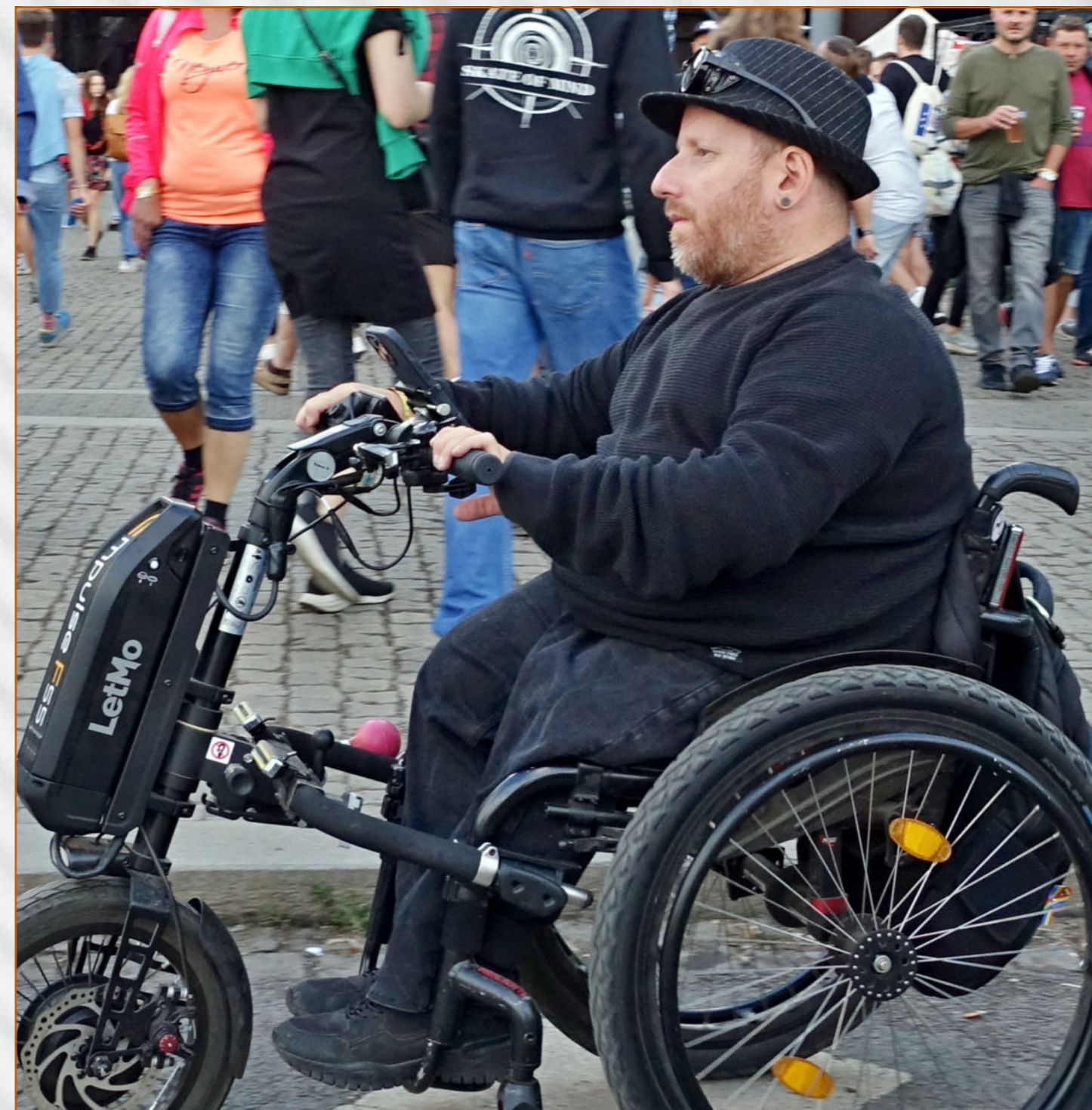
Magazín VOZKA každoročně monitoruje festival Colours of Ostrava a jeho projekt Colours bez bariér