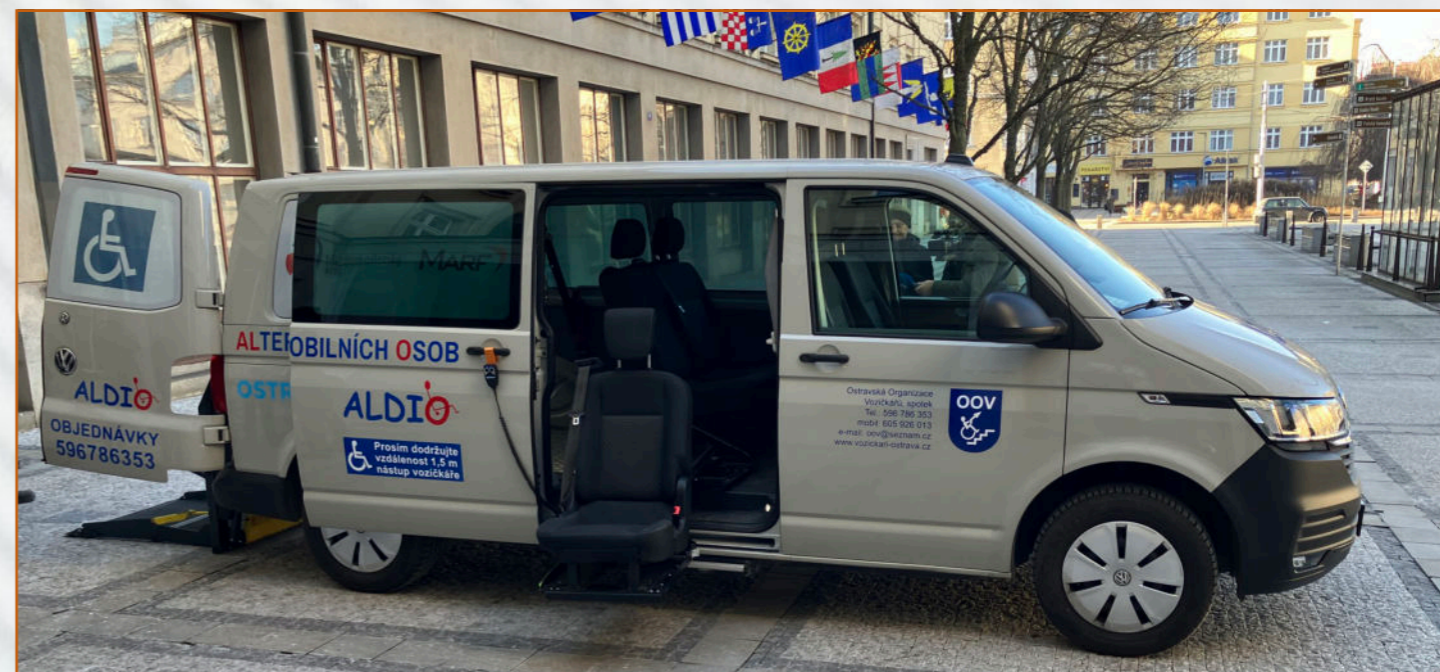
Nové vozidlo Volkswagen Transporter Kombi pořízené díky dotaci od statutárního města Ostravy při předváděcí akci v únoru 2025