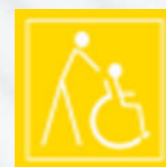
Částečně přístupný objekt