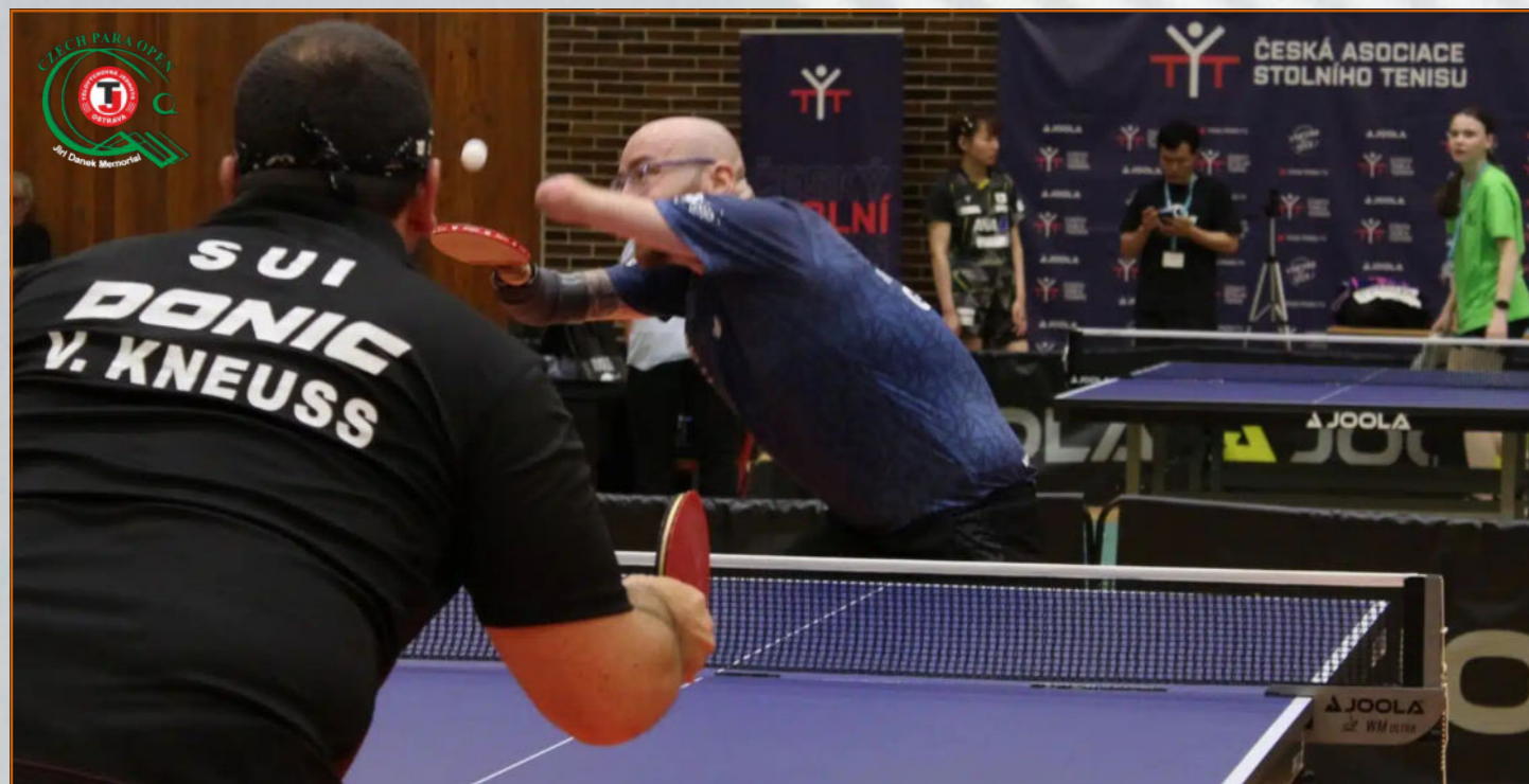
Přepravní služba ALDIO je každoročně partnerem mezinárodního turnaje ve stolním tenisu CZECH PARA OPEN v Ostravě